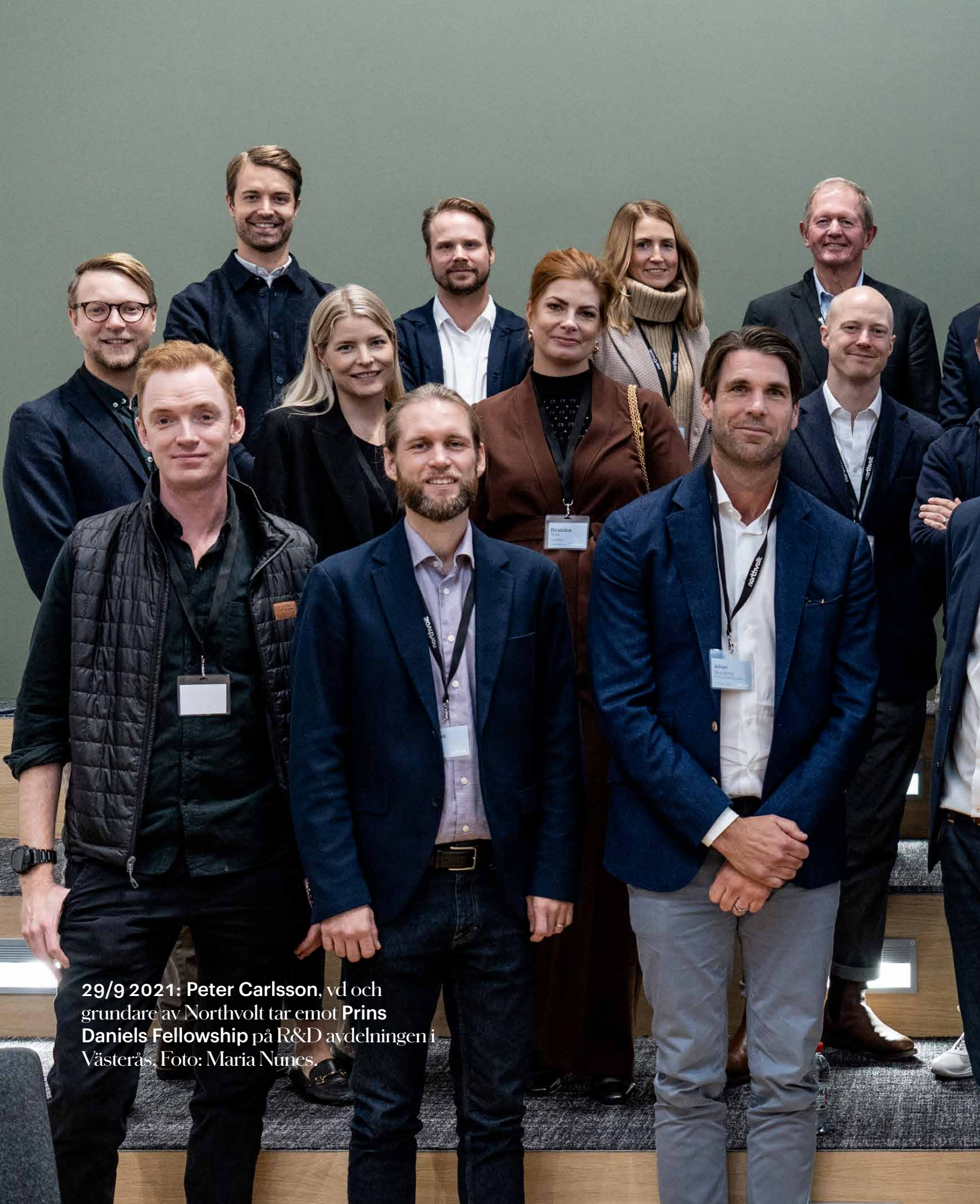
29/9 2021: Peter Carlsson, vd och grundare av Northvolt tar emot Prins Daniels Fellowship på R&D avdelningen i Västerås.